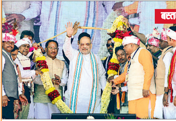
जगदलपुर में केंद्रीय गृह मंत्री अमित शाह का भव्य स्वागत किया

अमित शाह ने कहा कि पीएम मोदी का लक्ष्य बस्तर की संस्कृति और विरासत को विध्वंस तक पहुंचाना है, ताकि इसकी पहचान बंदूक और विस्फोटकों से नहीं बल्कि परंपरा से हो। शेष बचे कई नक्सलियों में युवा आदिवासी लड़कियां भी शामिल हैं, उनका पुनर्वास जरूरी है क्योंकि उनका पूरा जीवन आगे पड़ा है