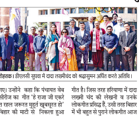
रोहताक। डीएलसीसुपवा में दादा लखीचंद को श्रद्धासुमन अर्पित करते अतिथि।

दादा लखी चंद स्टेट यूनिवर्सिटी ऑफ परफॉर्मिंग एंड विजुअल आर्ट्स (डीएलसीसुपवा) रोहताक में सोमवार को चार दिवसीय 'भारंगम' व 'सारंग' महोत्सव का भव्य शुभारंभ हुआ। उद्घाटन समारोह में मुख्य अतिथि के रूप में उपस्थित भोजपुरी गायक एवं सांसद मनोज तिवारी ने अपने लोकप्रिय गीतों से समां बांध दिया। उन्होंने अपने संबोधन के दौरान कई भोजपुरी गीतों को लाइन प्रस्तुत की, जिस पर दर्शक व छात्र झूमने पर मजबूर हो