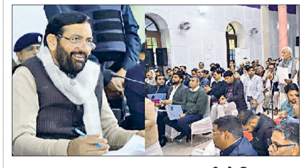
हरिभूमि न्यूज | गुरुग्राम

मुख्यमंत्री ने कहा कि अधिकारी जनहित से जुड़े कार्यों को सर्वोच्च प्राथमिकता देते हुए पूरी संवेदनशीलता और जिम्मेदारी के साथ करें तथा किसी भी स्तर पर कोताही न बरती जाए। उन्होंने साइबर सिटी की सड़कों की एक माह में मरम्मत के निर्देश दिए। उन्होंने कहा कि गुरुग्राम के समग्र विकास और आमजन की समस्याओं के समाधान को लेकर सरकार पूरी तरह प्रतिबद्ध है। जिले से जुड़ी प्रत्येक समस्या पर गंभीरता से विचार किया जा रहा है और उनका शीघ्र एवं प्रभावी समाधान सुनिश्चित किया जा रहा है। सरकार निरंतर जन समस्याओं की समीक्षा कर रही है, ताकि लोगों को समय पर राहत मिल सके और विकास कार्यों में गति बनी रहे। मुख्यमंत्री सोमवार को गुरुग्राम में जिला लोक संपर्क एवं कष्ट निवारण समिति की बैठक की अध्यक्षता कर रहे थे। बैठक में कुल 17 परिवार खर्चे गए, जिनमें से मुख्यमंत्री ने 12 का मौके पर ही निपटारा किया।